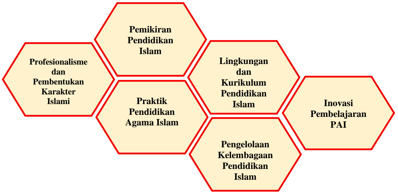
Gambar: Payung Peneitian Prodi PAI